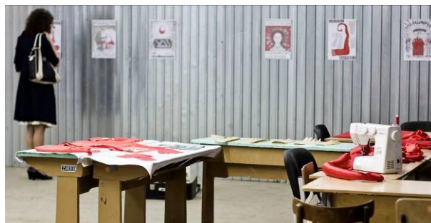
Леонид Тишков (Москва). Перформанс «Цех по производству даблоидов»

Так, прямо на глазах у посетителей был развернут самый настоящий конвейер – производство «даблоидов» (проект московского художника Леонида Тишкова ). По словам автора, даблоиды – это «фантомы человеческого сознания», весь багаж мыслительных и социально-бытовых клише, производство которых – путь к очищению и освобождению от всего что наболело. Работники Камвольного комбината делали заготовки по лекалам, сшивали и демонстрировали готовый продукт всем гостям ART-Завода 2009.